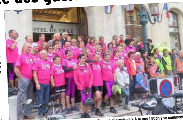
Sur le perron de l'Hôtel de Ville, l'équipée claironne: « Et on va où vendredi ? À la mer ! Et on y va comment ? À vélo ! »